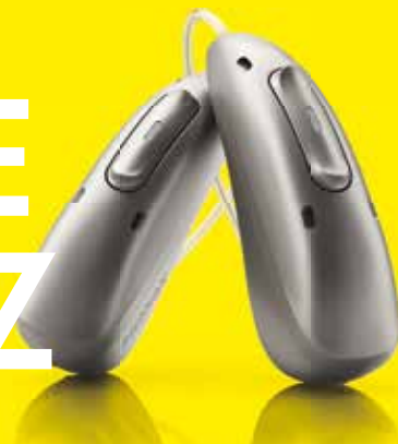
Phonak Audéo™ R Infinio