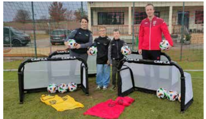
So kann man gut in die Rückrunde starten.

Punkten aus den Bereichen Vereinsleben, Schiedsrichter, Trainer etc. erreichte die SpVgg Goldstatus und erhielt Ende November ihre Prämie in Form von 20 Laibchen, 4 Minirenen, 10 Fußbällen und einem Einkaufsgutschein in Höhe von 200 Euro.